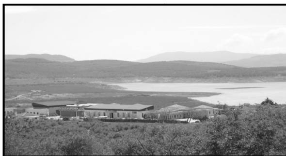
Imagen 2. Vista del Parque Guadalteba

Otras actuaciones se han dedicado a la reconstrucción de la memoria colectiva . A través de distintas acciones se impulsa la valorización de la historia recientes de las