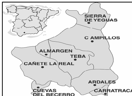
Figura 1. La comarca de Guadalteba

El paisaje más característico de la comarca es el de campiña que se extiende en la zona centro y norte de la comarca. Los relieves más importantes se encuentran al Sur. Los embalses Conde de Guadalhorce, Guadalhorce y Guadalteba suministran el caudal necesario para el abastecimiento de la ciudad de Málaga y de los regadíos del Valle del Guadalhorce. Este complejo de embalses tiene también un gran interés medioambiental, ya que esta comarca no utiliza sus aguas para el regadío, al ubicarse estos embalses en cotas muy bajas.